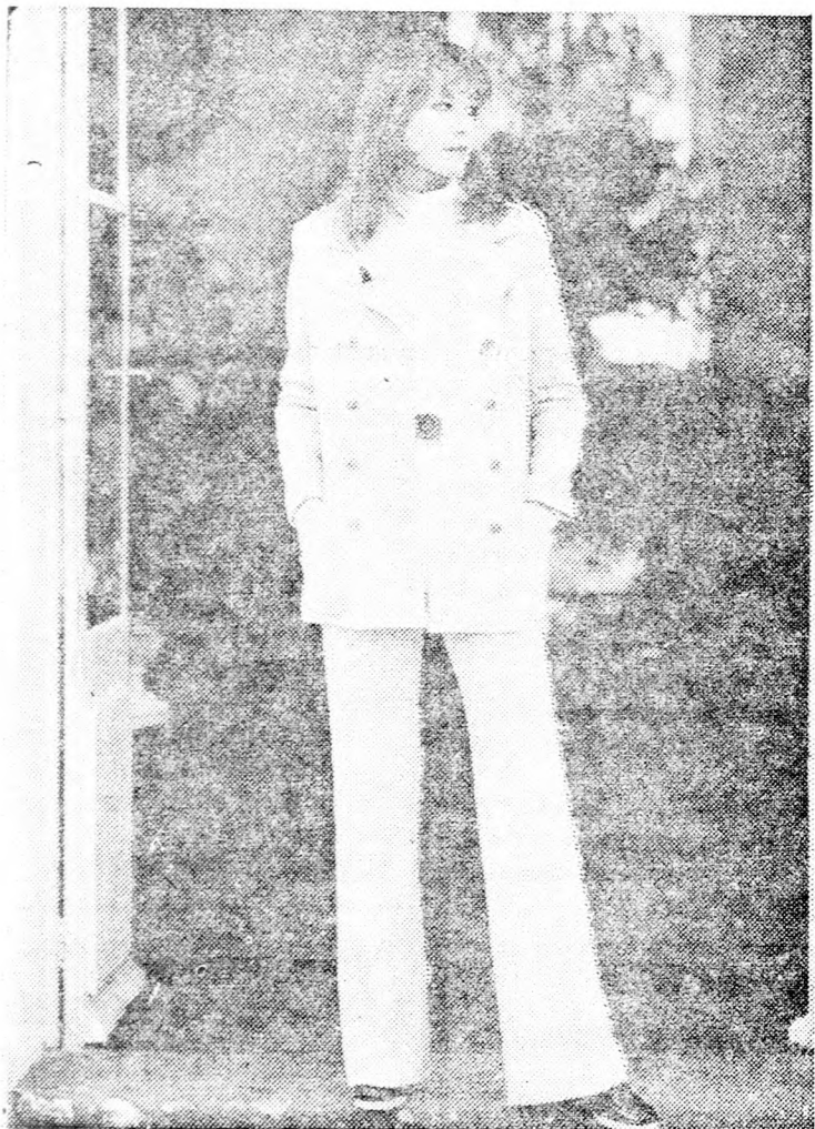
Mint hogy a meteorológiai intézetek hideg tavaszi jósolnak Európában, a párizsi divattervezők a fentiekhez hasonló melegnek látszó kosztüm-modelleket mutatnak be.