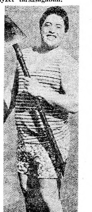
bele magát új feladatkörébe.

ELŐADÁSOK KEZDTE: 4.30 — 7.30 — 9.30 ALLENBY: A keresztapa BEN JEHUDA: Az ötödik csmó CINERAMA: Ben és Charly ESZTER: Szalma kutyák CAFON: Gúnyossgai ügy GAT: Unnepi fények GORDON: Unnepi fények OPHIR: A kules; félelem ORLY: Kükucsakok HOD: Szép lányok egyorban CHEN: Trenzy MAXIM Fogj nekem egy kemet MUGRABI: Fuzz PEER: Narancs szerkezet PARIS: Az utolsó mozielőadás FISHER: Mimi és Moskovits SBEROT, Kedvemre való férfi STUDIO: A mechanikus TEL-AVIV: A legözöndetetlen boxoló