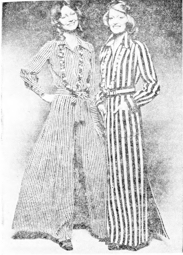
A Jean Louis Scherer divatház mutatta be a képen látható két ruhát tavaszi kollekciójában. Baloldalt krepp maxi, a másik blúz és nadrág komple felér-fekete csizósú vászonzól.