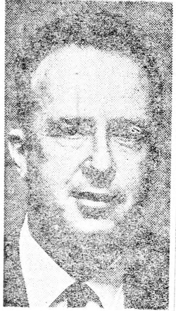
sítés Golda Meír közeli amerikai látogatását.

Jicchak Rabin, Izrael amerikai nagykövete tegnap rövid látogatásra az országba érkezett, hogy beszámoljon a miniszterelnöknek Nixon elnökkel folytatott legutóbbi találkozásáról és egyben előké-