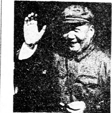
MAO CE-TUNG Üdvözlét Nixon elnöknek

A diplomáciai szokványok egyáltalán nem kötelezték a kínai elnököt arra, hogy Kissingeret fogadjja, tehát ez a találkozó teljesen váratlan volt és abban a kínai elnök baráti gesztusát látják. Kiemelik egyébként, hogy Mao elnök aktív szerepet játszik