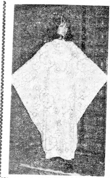
DERBY KNIT EZÜST-LUREX ESTÉLYI ÖLTÖZEKE — DENEVÉR UJAKKAL

nem egyszerű a nadrág és a zakó. A kockás és az aprómintás anyagokból férfiak számára is nagy választékban készülnek ruhaanyagok. Ami a női divatot illeti — a szoknya általában térdig ér. Nem ilyen egyszerű a helyzet a