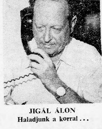
JIGÁL ALON Haladjunk a korral... Az arab nyelv oktatásáról azt mondotta Álon miniszter, hogy már több kísérlet volt a mindennapi arab nyelv oktatására zsidó órák körében, és most tanulmányozzák azt a lehetőséget, hogy a kötelező idegen nyelvek

Jigál Álon elmagyarázta, hogy a nemi felvilágosítás a biológiai, anatómiai és fiziológiai órákon kívül más, szociológiai, illetve pszichológiai elemeket is tartalmaz és a tantervet a közoktatási minisztérium, valamint az egyetem szakértőinek közreműködésével készítették el.