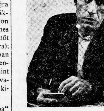
Jelenet a „Szeretlek Róza” című filmből

ban legesélyesebb vetélytársa Liv Ullman, a nemrég feledezett norvég „északi csillag” tesz. A fér-