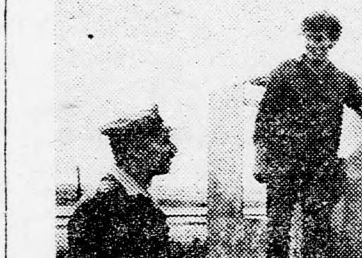
Hod tábornok az iskola növendékeivel beszélget

Az Amal szakiskola-hálózat repülőgépteknikai iskolája a legna-