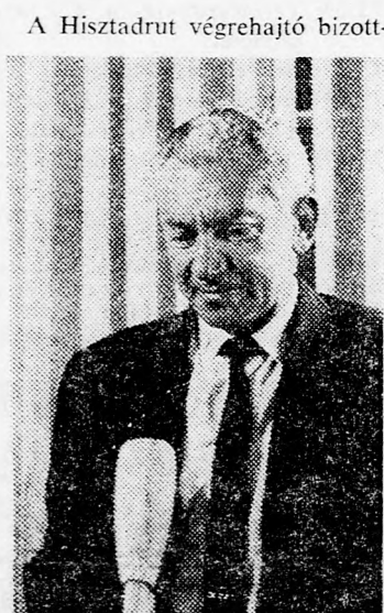
CHAJIM BAR-LEV: Szigorú ellenőrzés

A Hisztadrut felhatalmazta a keretében tartó fagyaszott hatóságát, hogy heti ellenőrzést tartson az árak felett és arról jelentést nyújtson be a központi bizottság heti ülésén. Ugyancsak ragaszkodik a Hisztadrut ahhoz, hogy a kiskeresetű családok megfelelő kárpótlásban részesüljenek az áremelésekről.