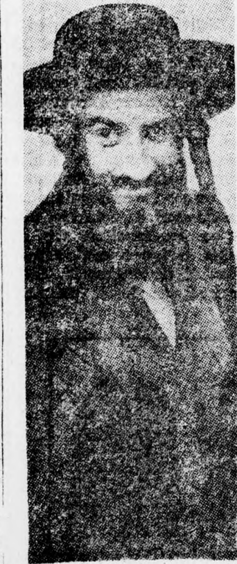
LOUIS DE FUNES, mint „Rabbi Jákov”