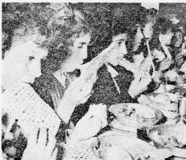
SZEDER AZ ISKOLÁBAN