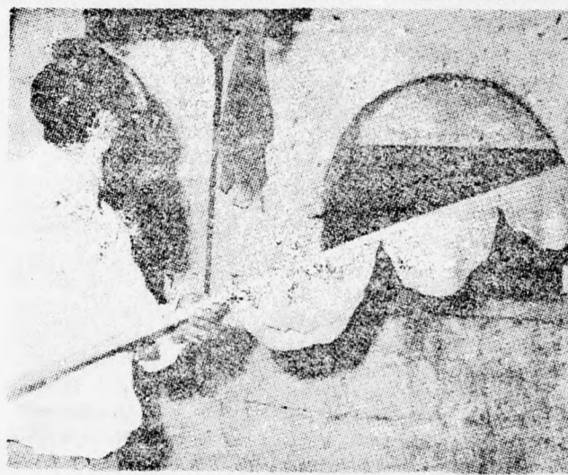
IGY SÜTIK A SMIRA MÁCÁT

Sáári, aki Pádesz Cháná — Karkurban tett látogatást, mint a somroni fejlesztési üzemek vendége, többek között ígértett, hogy Pádesz Cháná—Karkurt is turista látogató helyévé fejlesztik és e célból a helyi tanács 100 dunamos erdős területet bocsátott egy hollandiai befektető vállalat rendelkezésére, amely azon bungalovokat, sátrakat és füves területet létesít. Az alminiszter végül ellátogatott Binjáminára és Zichron Jákobba is, mert ezeket a helyeket is bekapcsolják a turisztikai forgalomba.