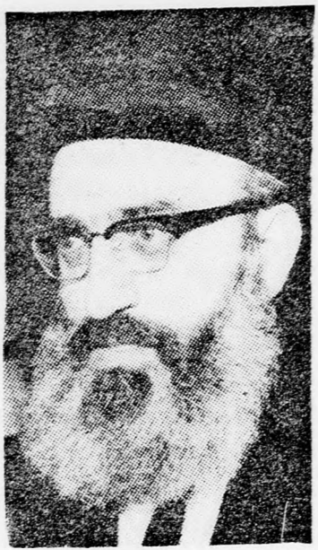
GOREN ORSZÁGOS FŐRABBI Az idén Chevronban

A Nyugati Falnál egyébként reggel 8 óra 30 perckor a Sáhárít ima keretében és 9.45 óra körül pedig a Muszaf ima keretében tartják meg a „Birkat Kóhánim” áldást, amelyre több ezer