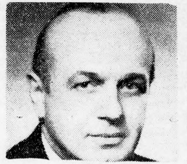
TEKOA Erélyes stílusban

Az egyiptomi külügyminiszter nem vetette fel Izrael kizárásának