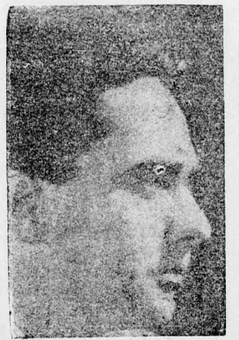
KERTÉSZ ISTVÁN: Végzetes fűrdőzés...

A szerencsétlenség hétfőn délután történt, amikor Kertész István a Hayden Nelson-mise néhány szolisztájával fűrdőre indult a herzliai tengerparton. Társai hirtelen észrevették, hogy egy hullám elsodorja Kertészt. Egyesek utána usztak, mások segítségért szaladtak, de mire a karmestert kihúzták a vízből már nem volt benne élet és a mentők élesítési kísérlete hiabavalónak bizonyult.