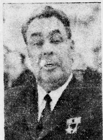
BREZSNYEV Jószomszédi viszonyt!

Bonn. (Reuter, UPI, IFF). — Harmadézer rendőr védőgyűrűje közepette kezdte meg bonni tárgyalását Leonid Brezsnyev, a Szovjetunió kommunista pártjának főtitkára, aki péntek reggel Andrij Gromiko külügyminiszter kíséretében és népes kísérettel élén ótnapos hivatalos látogatásra Nyugat-Németországba érkezett.