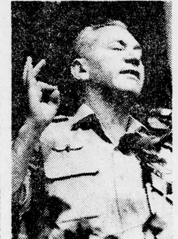
CHAJIM BÁR-LÉV Mindenkinél engednie kell

Scheel tegnap délután megérkezett Ammanba, közel-keleti látogatásának második állomására.