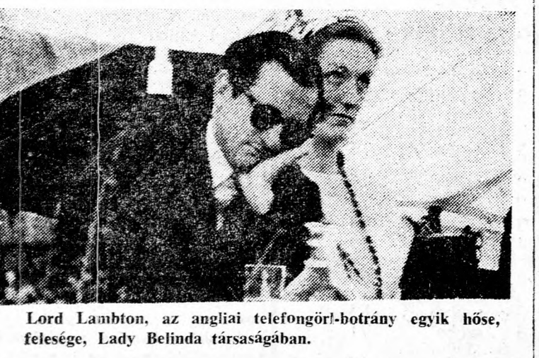
Lord Lambton, az angliai telefonörül-botrány egyik hőse, felesége, Lady Belinda társaságában.