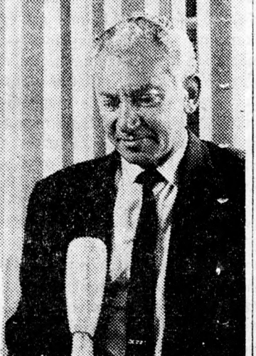
BÁR-LÉV: Küzdelem az infláció ellen

Mindazoknak a rokonoknak, barátoknak, ismerősöknek, akik a sívá alatt személyesen vagy írásban részvétüket fejezték ki, ezúton mondunk hálás köszönetet.