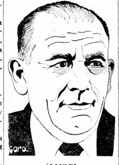
ÁLMOZI: A város összes polgárainak javára ...

Mindazoknak a rokonoknak, barátoknak, ismerősöknek, akik a sívá alatt személyesen vagy írásban részvétüket fejezték ki, ezúton mondunk hálás köszönetet.