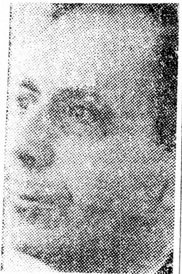
SLOMO HILLEL A hatnapos háború előtt is

rendőrszjele és a környékbeli települések vezetői előtt tartott