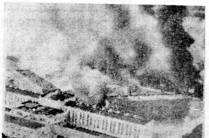
Az amerikai Oklahoma állambeli McAlester börtön fogyenceinek lázadása során felgyújtották a fegyház egyik szárnyát. A lázadásnak, mint ismeretes, két halottja és ötven sebesültje volt.