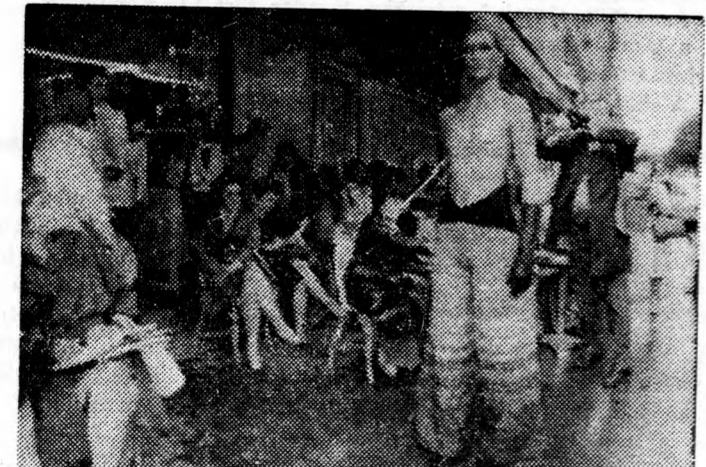
A képképünk látható férfi-maneken nem zavartatja magát a járőrelők furcsálló tekintetétől, amikor a párizsi utcán bemutatja a Genet-ház egyik „szellős” ruháját.