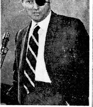
MOSE DAJÁN Mi lesz Jámittal?

A megkérdezettek statisztikai elemzéséből világosan kitűnik, hogy a magzatelhajtás abszolút engedélyezését főleg a nyugati államok, valamint az ország szülői és elsősorban a magas iskolai képzettséggel rendelkezők, valamint a 35 éven aluliak támogatják. Ezzel szemben az ellenzők többsége az 50 éven felüliek, a keleti származásúak és a kevés iskolai végzettséggel rendelkezők köréből kerül ki. A férfiak liberálisabbak a közvéleménykutatás női résztvevőinél.