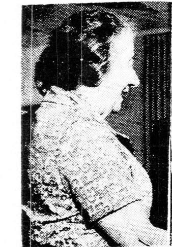
GOLDA MEIR Terepszemle...