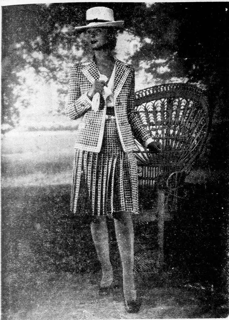
A férfiruhát utánzó női kosztümök divatja egyre jobban terjed. Most már dupla gombsorú kabátokat is látunk. — Fenti kosztüm is kétsoros kabáttal készült, és plissírozott szoknyájával. V-alakú kivágású blúzzal viselik.