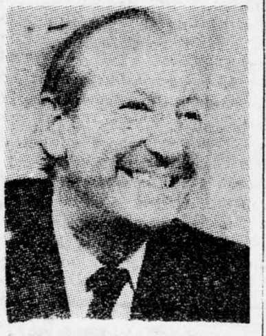
Dr. KURT WALDHEIM

kell az erőfeszítéseket a rendezés érdekében. A főtájkár tegnap este egy genfi szállóban vacsora keretében tárgyalt dr. Gunnar Jarringgal és ma reggel ismét terített asztalnál találkozik vele, mielőtt elindul Damaszkuszba, ahová első ízben hívták meg az UNO főtájkárát.