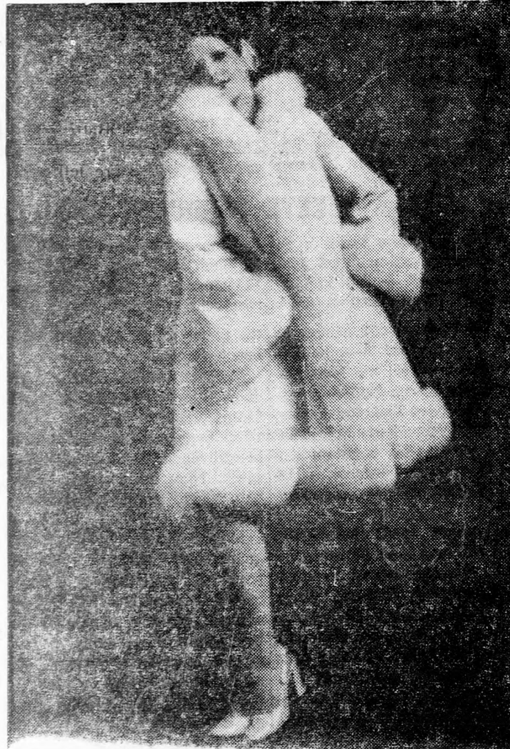
A francia szőrmetermetek legutóbbi kiállításán a Dior-Ház is résztvevő a képünkön látható Breitschwanz-kabát, amelyet ezüstszálú szegéllyel kombinált.

A kéthónapos iskolai vakáció tulajdonképpen nem volt jó, legalábbis nekünk, mamáknak nem, mert egyetlen óriási fel-fordult nappal olvadt össze, hogy minden és mindenkit az otthon rajcsurozó nebulók „szempontjának” kellett alá-vetnünk. De azért... ha magunkba nézünk egy percre, úgy rájövünk, hogy sokmindent még is jó volt ez a vakáció. Például: Egyszer-kétszer ágyba kap-tad a reggeli, ami lehet, hogy jéghideg és keserű volt, viszont a saját különbejárta fiad (lá-nyod) szervizolta szeszre. Igaz, hogy hosszabb, vagy rö-videbb vonakodás után, de i-vadékos leszállt helyetted a