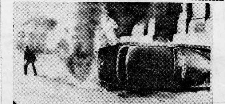
Santiago de Chile utcáin állandóan folynak a tüntetések. A teherautó sofőrök sztrájkja úgyszólván megbénítja Chile gazdasági életét, a városi tömegek egyrésze pedig Allende elnök mellett tüntet. Képpünkön egy tüntetés során felborított és felgyújtott autó látható, a chilei parlament épülete előtt.