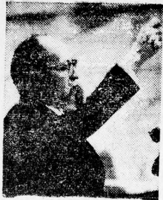
MENACHEM BEGIN Talán majd később...

Ariel Saron és Ezer Weizman szolgálaton kívüli tábornokok bejelentésére reagálva, hogy az egyesülés kudarcát esetleg nem