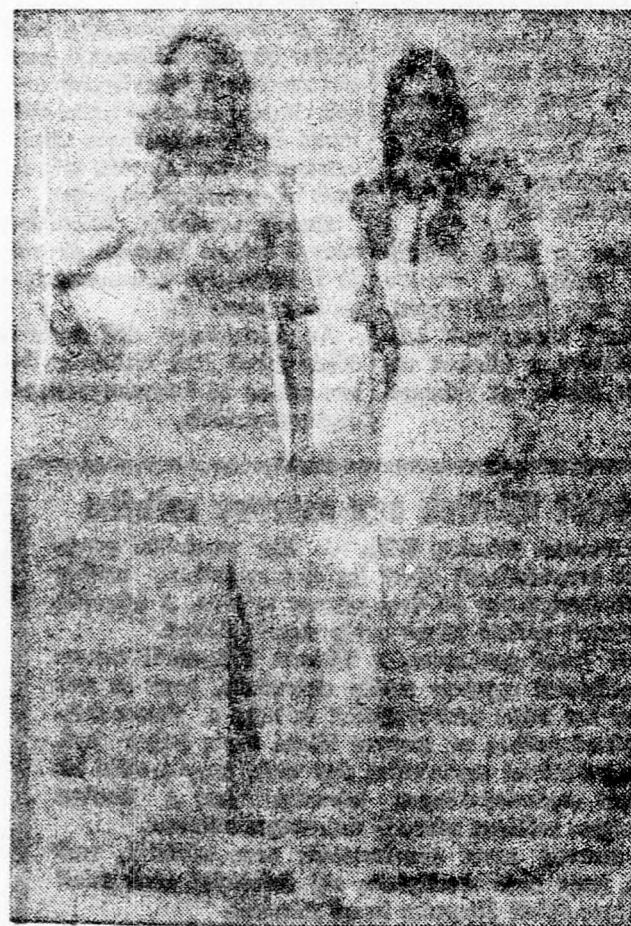
Ezek is Courreges modellek: baloldalt hosszú ruha szövetből, organdi gallérral, mellette estélyi ensemble: hosszú szoknya és rózsaszín szövet blúz.