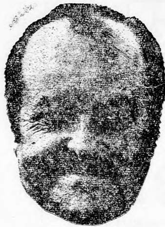
WILLIAM CONRAD Cannon szerepében

Cannon személyében egy egészen különleges magán-detektív típusát ismerhetjük meg. — Mig Mannix fiatal, magas, jóképű,