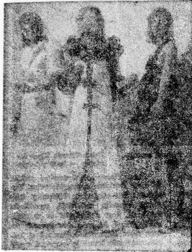
A híres párizsi Courreges szalon három szép estélyije az 1973-as téli bemutatón.