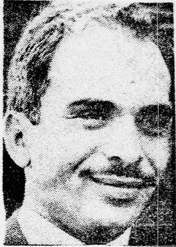
HUSZSEIN: Diplomáciai kapcsolatok...

Politikai megfigyelők hozzáfűzik, hogy Kairónak ez a lépése, az Ammannal való viszony normalizálására, a visszatérésre talán majd Gádafihoz is meg kell szólítani.