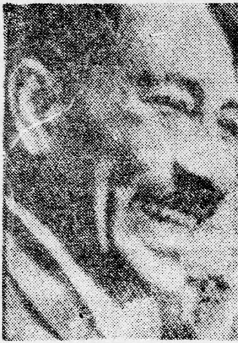
SZÁDAT: Fejzárall Gádafi ellen

Kairó, (UPI, Reuter, IFF). — Anuár Szádát egyiptomi elnök, valamint Chafez Aszád, Szíria államelnöke Huszsein királlyal tegnap a Kube palotában megkezdtek csúcskonferenciájukat. Ezt megelőzően az egyiptomi államelnök külön megbeszélést folytatott Huszsein királlyal és a szíriai államelnökkel.