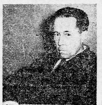
SZOLZSENYICIN Zácharov megérdemli a Nobel-békedíjat

Genf. (Reuter). — A Nemzetközi Vöröskereszt finnországi kirendeltsége tanulmányt tárgyavá tette Zácharovot az a kérelmet, hogy a szervezet, nemzetközi bizottság útján vizsgálja ki azt a vádat, hogy a szovjet hatóságok teljesen egészséges politikai foglyokat elmeegógyintézetre zárnak.