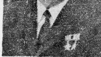
LEONID BREZSNEV: Technológia, nem ideológia

Kelet-európai diplomaták véleménye szerint befolyásos szovjet vezetők azon állásfoglalása, hogy a békes együttélés nem terjedhet ki az ideológiai terésre és mindarra, amit ez magában foglal — elgáncsolhatja ezt a törekvést, hogy szorosabb gazdasági és kulturális kapcsolatokat hozzanak létre a nyugati világgal.