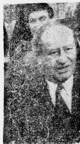
KREISKY KANCELLÁR Sajtónyilatkozata ...

A tegnapi nap meglepetésével a Rudé Právo című prágai pártiszócsó sahat, amely megállapította, hogy az egész terrorista támadást Marchegggen az izraeli és az amerikai titkosszolgálat rendezte