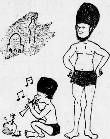
IMPORTVICC A FAKIROK VILÁGÁBÓL

RÉMES RIMEK Az egyiptomi vezérkar főnökének lenne egy baráti jótanácsom, mivel kiderült néhány napja, hogy gyenge legény volt a gáton, nyújtsa be tüstént lemondását és adja át a posztját másnak, aztán adjon fel apróhirdetést az Új Kelet „Állás” rovatának. (meredek)