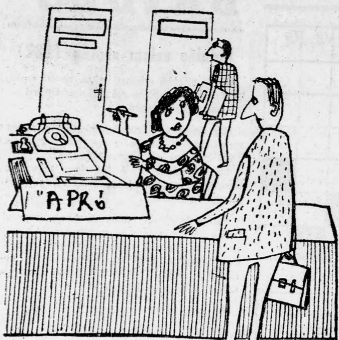
A KÉTERTELMŰ HIRDETÉS — Nem egészen világos az ön hirdetése. Tulajdonképpen feleséget, vagy lakást keres?