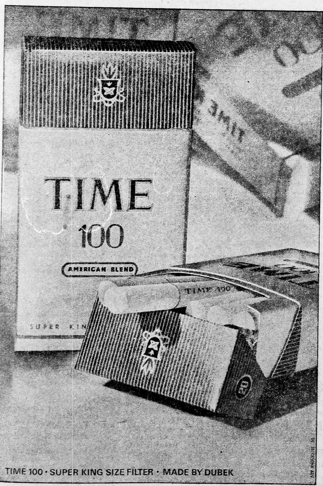
TIME 100 • SUPER KING SIZE FILTER • MADE BY DÜBEK