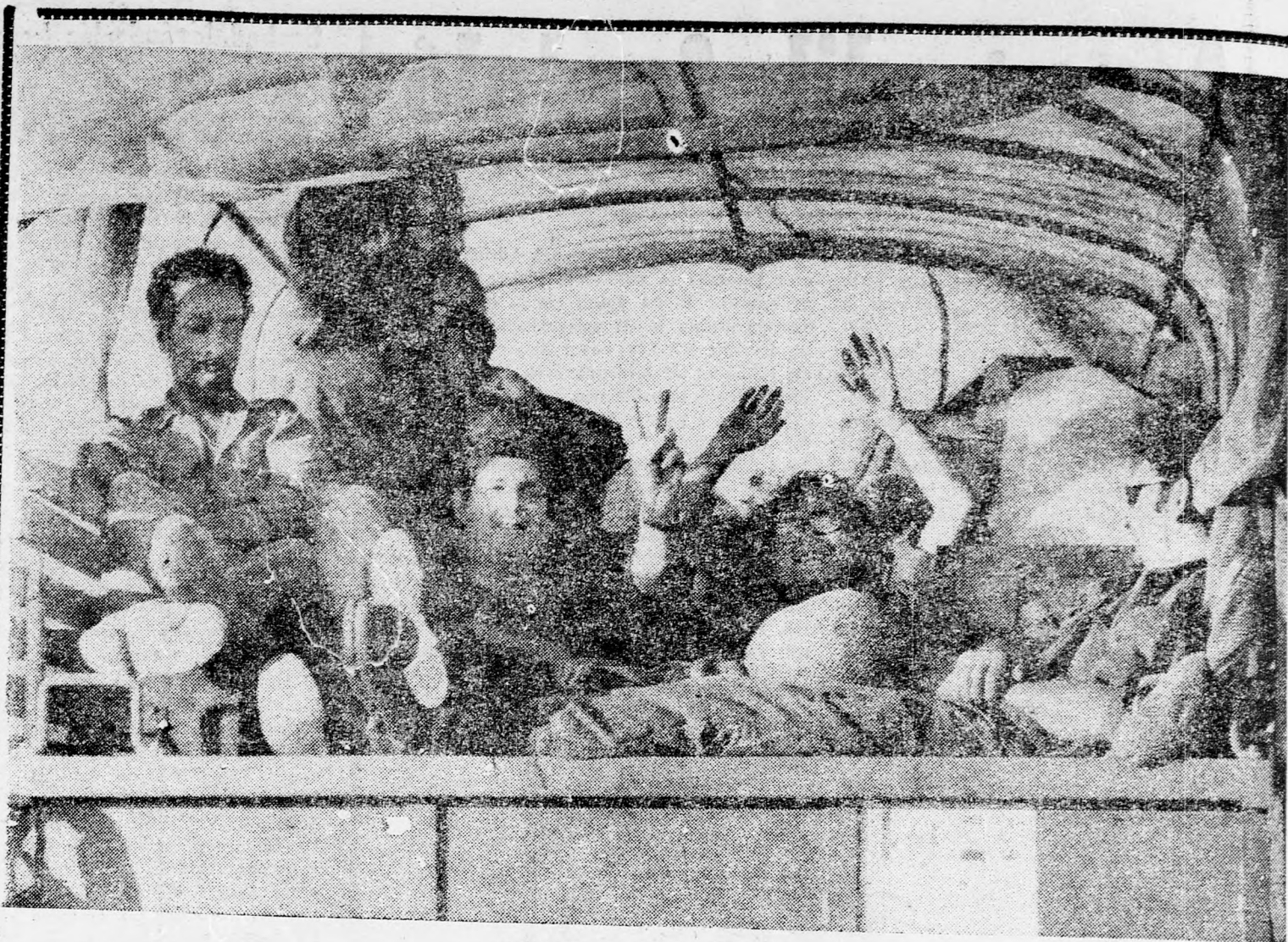
UTBAN A FRONTRA...