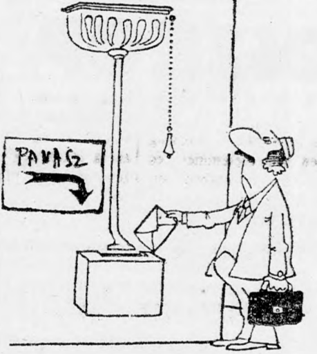
A PANASZOS LEVELEK BÜROKRACIAMENTES ADMINISZTRÁCIÓJA

*** A szegénységet nem kell szégyelni. Csak néha a gazdagságot.