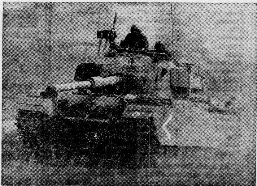
A HAZA VÉDELMEBEN

Ha ez valóban az Itélkezés Napjának a háborúja, akkor nincs más választásunk, mint térdre kényszeríteni Egyiptomot és Szíriát. Nem tudhatjuk, hogy ez mikor következhet be. Csak azt tudjuk, hogy az „Itélkezés Napjának háborúja” nem fejeződik be hat nap alatt, mint a diadalmas 1967-es háború. A zsidó népek úgy látszik nem adott meg, hogy békés eszközökkel vivja ki függetlenségét. Vérről érte megfizetni. Sajnos szomorú gyakorlatunk van abban, hogy szülőket kell vigasztalunk elvesztett gyermekük miatt, előzvegyült asszonyokat és elárvult gyermekeket kell biztosítanunk a társadalmunk szeretetéről minden háború után. Ez a honfoglalás borzalmasan súlyos ára. Az ellenértéket csak az Itélkezés Napján kapjuk meg érte.