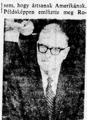
sem, hogy ártsanak Amerikának. Példaképpen említette meg Robert Kennedy szenátor meggyilkolását.

Szombaton este a Siduré Jiszráél magyar adásában közölték, hogy naponta lesz magyar nyelvű műsor, este 7.15 perckor. Minthogy olvasóink közül számosan hiába keresték a magyar műsört készültekükön, megkérdeztük a rádió hírszerkesztőjét, amelytől ezt a felvilágosítást kaptuk: A 15 perces magyar adást a 16, 19, 25, 33.3 rövidhullámokon közvetítik, de technikai okokból ezeket csak ultrarövid (FM) hullámhosszakra berendezett készüléket lehet Izraelben hallani.