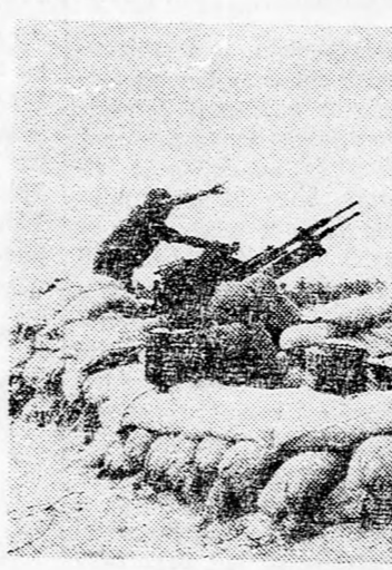
LEGELHARÍTÓ ŐREG A DELI FRONTON

tíktát és nem kíván más országok felett uralkodni, hanem a világbékét segíti elő.