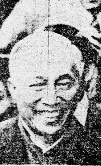
LE DUC THO

„Dr. Henry Kissinger és Le Duc Tho több mint három éven