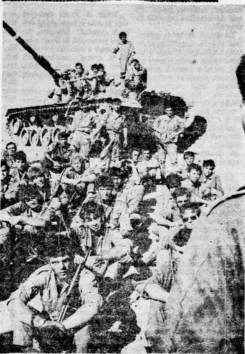
Két nagy tankcsata közötti szünetben „egyszerű hétköznapi problémák” foglalkoztatják a katonákat. — Képviselet az egyik tankegység katonái a fronton fellépő művészek előadását hallgatják.

— ONKENTES RENDŐRKET eskettek fel hétfőn Háfán. Az első 40 önkentes rendőr a Hágán veteránjai közül került ki, és egyesek közülük az angol mandátum elleni küzdelem idején az akkori börtönben raboskodtak. A Hágán veteránjainak akkori csoportja küzdött, hogy összesen 250 ilyen segédrendőrt mozgósít tagjai körében, akiket a rendkívüli időkre szóló rendelet értelmében hatáskörrel ruháznak fel.