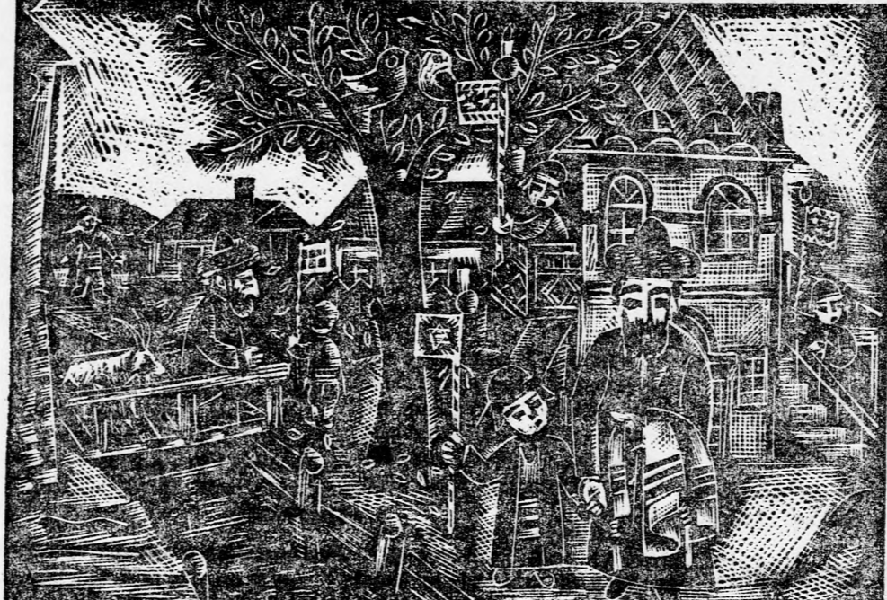
SZIMCHÁT TÓRA (Illya Schor, a híres new-yorki zsidó művész fametszete)

A szimchat tórai énekre a chasidizmus róttá rá nagyban a bélyegét. A chasidizmus mentalitása azt hirdeti, hogy „az ének az Isten trónusa felé vezet” — a fohászokdás a dal isten-nyán gyorsabban jut el Istenhez mint az ima”. A „tant”, hogy Isten táncdal-dallal köcsöstitük, a chasidizmusnak köszönhetjük nagyban, az színtette, gazdagította a zsidó lélek életét — általában, és különösen szimchat Tóra napján.