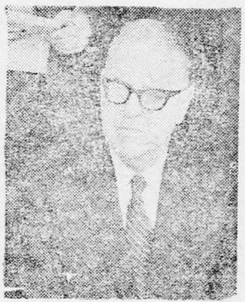
Aba Even, Izraeli külügyminiszter

A Kuiu Maru néhány héttel ezelőtt érkezett Ejlátha tonhalrakománnyal izraeli konzervüzemek számára. Két héttel ezelőtt a hajótulajdonos társaság felszólította a kapitányt, hogy térjen vissza a Távol-Keletre a Bab el-Mandeb-i blokádtól ellenére.