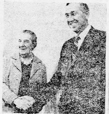
GOLDA MEIR ÉS J. SISCO: Javaslatai Kairóból

Kissinger tegnap az egyiptomi elnökkel folytatott háromórás megbeszélés után kijelentette, hogy „közeledünk a békehez”. Szádát az újságírók kérdéseire azt mondta, hogy egyet ért Kissingerrel.