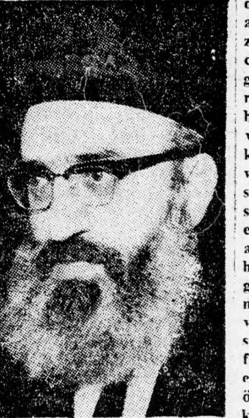
Slomo Goren országos főrabbi

benne élő egyén létét. Ezáltal nem volt szó preventív háborúról, amely meglepi az ellenséget és végeredményben az ellenség területén folyik. Az izraeli hadsereg ezáltal a nevében is rejő önvédelmi feladatot töltött be. Ugyanakkor mindnyájunknak el kell ismerni, hogy a hadsereg olyan győzelmet aratott, amely elhomályosítja az előző sikereit, s a katonák ilyen hősiességére sincs eddig példa. Ezáltal sikerült meglepni bennünket és megis feltartóztattuk a rengeteg modern fegyverrel felszerelt soktízezer fős ellenséget. A történelemből megtanultuk: 1.) A Mindenható segítségével sikerült fokozni erőnket, rendezni a sorsunkat hadállás-