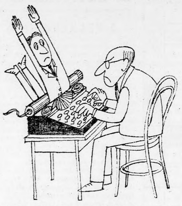
EGY IRÓ, AKI HUSBÓL ÉS VÉRBŐL VALÓ ALAKOT KÉPES TEREMTENI