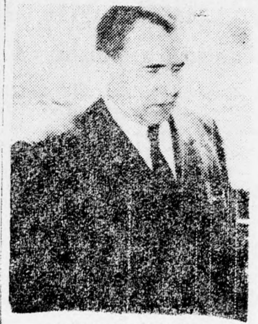
ANDREJ GROMIKÓ: A palesztinai kérdés a legfontosabb