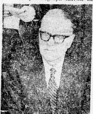
ABA EVEN Háiba várt...

Az új kinevezésekről Dávid Eljár tábornok, vezérkari főnök, Mose Dáján hadügyminiszterrel összehangolva döntött. Az új kinevezések magasrangú feladatok betöltésére vonatkoznak.