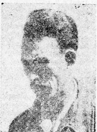
BOUMEDIENNE „Jégen test”

hogy az arab csúcskonferencián a palesztinákat képviselje — amit Jordánia kezdetől fogva elvetett.