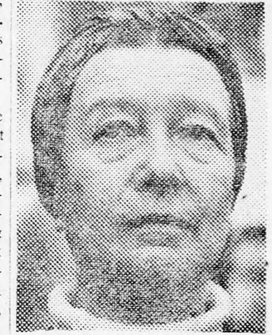
SIMONE DE BEAUVOIRE

hosszátartozóinak három tagú küldöttsége tegnap New Yorkban tartott sajtófogadáson elmondotta, hogy Waldheim UNO főtitkár egyik munkatársa úgy nyilatkozott, mely aggodalommal kíséri