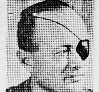
DAJAN Ne csináljatok ostobaságot!

„Már meguntunk benneteket, menjetek el innen... A délelőtti órákban a légihad-