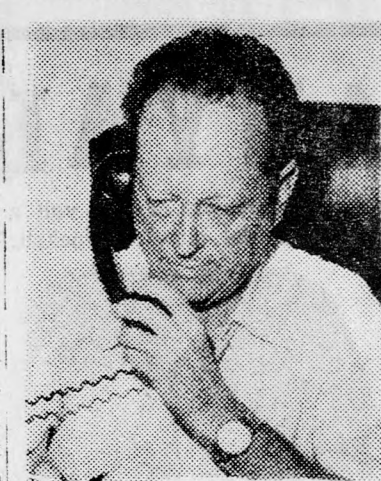
ALON: Mi van az ígérettel?

Dr. Schlesingerrel azoknak a hadfelszerelési szállítási ígéretnek megvalósításáról lesz szó, amelyeket Nixon elnök jeruzsálemi látogatásakor kapott Izraeltól. Az amerikai sajtó közben foly-