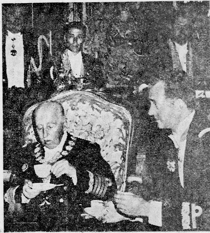
A madridi előlki palota egyik tanácstermében Franco államfő kávézik az eljövendő spanyol királlyal, akit a közeljövőben „ideiglenesen” megbízott az állam vezetésével. Ez a kép tavaly készült.

titkolták a Caudillo (vezér) betegségét: hamis volt a széles mosoly a beteg Franco szobájából távozó vendégek arcán, alaptalanok voltak orvosi és a környezetéhez tartozók optimista nyilatkozatai és mindössze szemfényvesztés volt az a példátlanul sok „információ”, amelyet a hatóságok a telekommunikációs szolgálat segítségével terjesztettek.