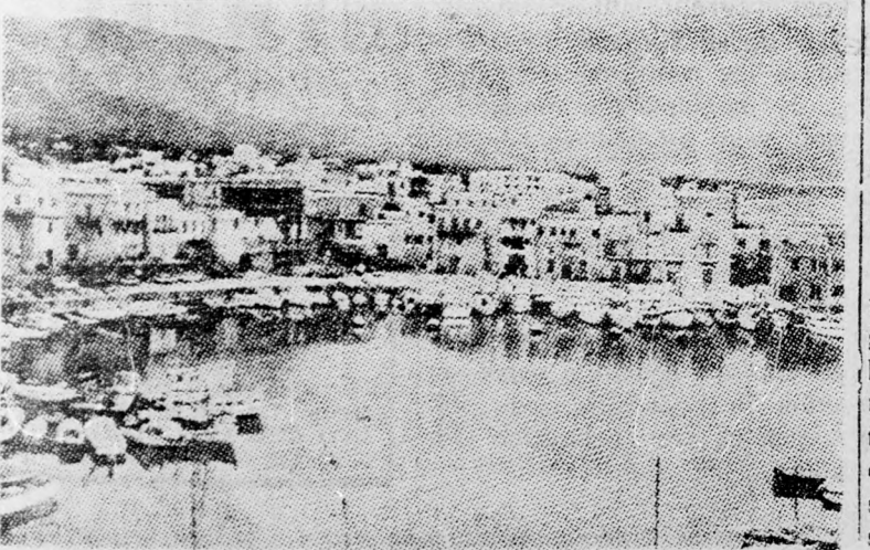
A ciprusi Kyrenia kikötő látkepe. Kyrenia most a török csapatok partaszállításának legfőbb pontja.

A brazil „cseléd-importőrök” úgy igyekeznek ezzel a nehézséggel megbirkózni, hogy a lányokat előzetesen egy gyorsfalpaló tanfolyamra küldik, ahol kioktatják őket a minimális írásra, olvasásra és számolásra. Ehhez azonban időre és pénzre van szükség és addig az európai „cseléd-mizéria” napról napra súlyosbodik.