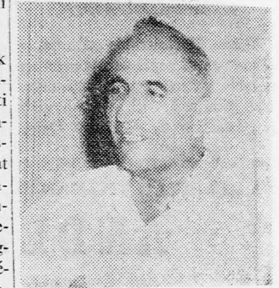
MESEL: Megakadályozni a túlzott nyereségeket

„A Hisztadrut tovább folytatja küzdelmét azért, hogy mindenki megfizesse a reál-adót és megakadályozza a túlzott nyereségeket