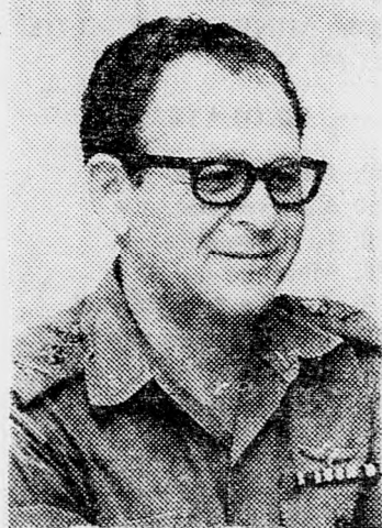
GUR TÁBORNOK Esetleg három fronton

Fennáll az a lehetőség is, hogy Szíria, amelynek rendkívül komoly hadereje van.