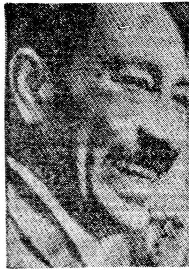
S Z A D Á T Merev magatartás

ez az igaz oka annak, hogy a Kreml sürög moszkvai látogatásra hívta meg Áráfátot.