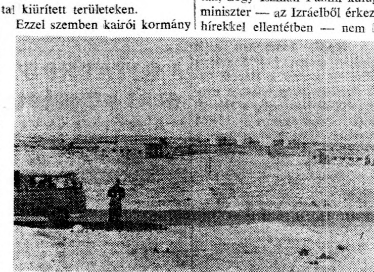
ABU RODESZ: A KÖLAI-TARTALYOK

Ez az egyiptomi álláspont választás képezte Jicchák Rábin miniszterelnök sajtónyilatkozatára, amelyben leszögezte Izrael feltételeit a megállapodás következő szakaszára. Rábin miniszterelnök arra utalt, hogy Izrael nem mond le a Mide és a Dzsidi szorosokról és nem adja meg hozzájárulását ahhoz, hogy Egyiptom csapatokat helyezzen el az Izrael által kiürített területeken.