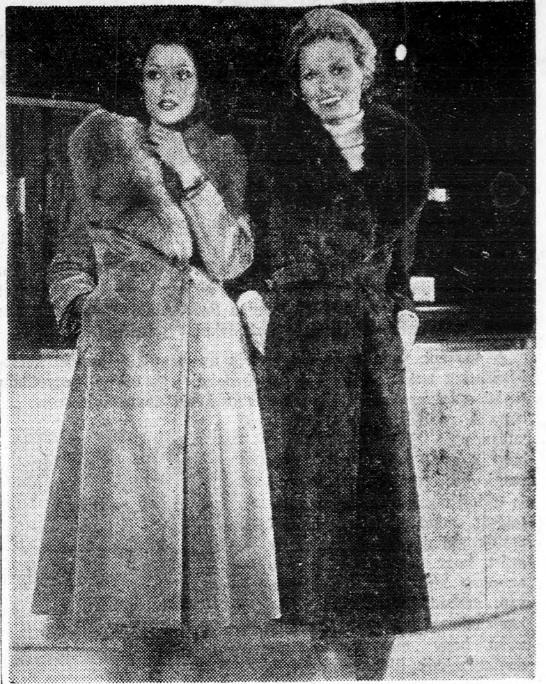
Két csinos antilop-kabát nagy szőrmegállással — párizsi divat

Írás dolga. Nekem ez a legújabb divat nem tetszik. Azt tartják divatosnak, ami régmódi. Nem vagyok egyedül ezzel a véleményemmel. Nemrég Art Buchwald is megírta. Humoreszkjének ez volt a címe: „Az szép, ami csúnya”. A humorista — a műfaj szának megfélemlen — a feleségéről írt, aki hazatért bevásárló körútról, és azonnal fel is ült a ruhadarabok nagyon ismerősnek tünnek Art Buchwald számára. Mintha már látta volna valamennyit.