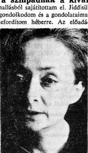
sokon megtörténik, hogy nem értek meg valamit és ilyenkor diák társaimhoz fordulok felvilágosításért. Mindig készségesen hajlandók segíteni. Néhány nappal ezelőtt új diákány irfkozott be