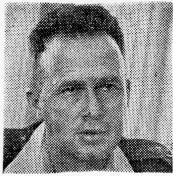
RÁBIN: Nincs kapcsolat!

A tegnapi minisztertanács kérdéseket tettek fel a kabinet tagjai ezzel az ügygel kapcsolatban. A probléma rövid megvitatása után Rábin kijelentette, hogy a zsidó nép egyik központi problémájának tekintette és tekinti ma is a küzdelem folytatását mind a szovjetunióbeli zsidók alijajogáért, mind pedig azért, hogy más országokból, ahonnan kijövetelük korlátozva van, szabad kivándorlási jogot kapjanak. Ugyancsak közölték azt, hogy megszűnőn mindenütt "zsidók üldözötése.