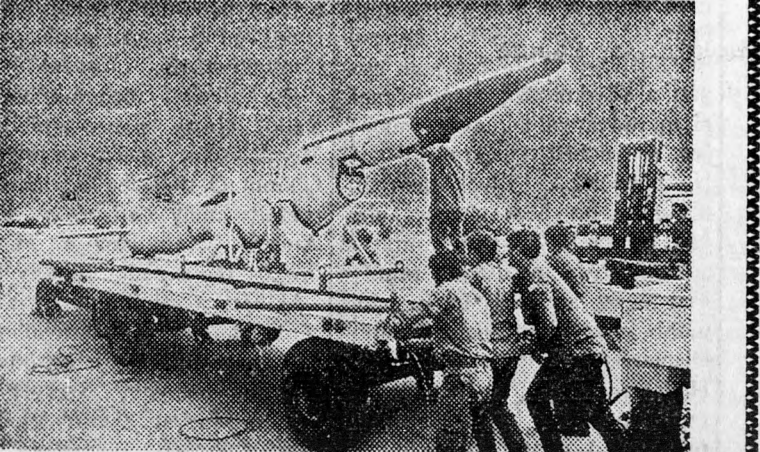
Az izraeli hadsereg birtokában lévő pilóta nélküli repülőgépek