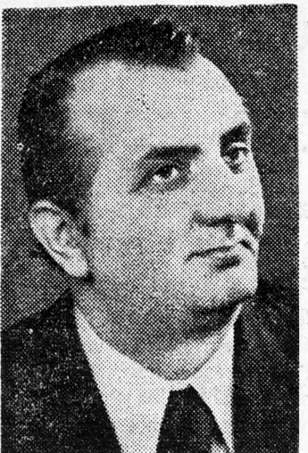
Nem csalódtam, csak szinte érthetetlenül álltam és igyekeztem megmagyarázni magamnak...