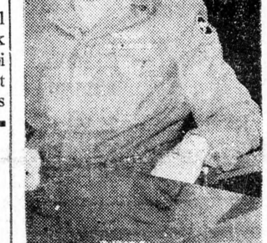
ZEEVI TÁBORNOK „Alkalmas!”

„Az arab államok vezérkari főnökei Egyiptom fővárosában tanácskoztak és néhány titkos határozatot fogadtak el, amelyeknek célja fokozni az arab államok katonai potenciálját az Izrael elleni küzdelemben.