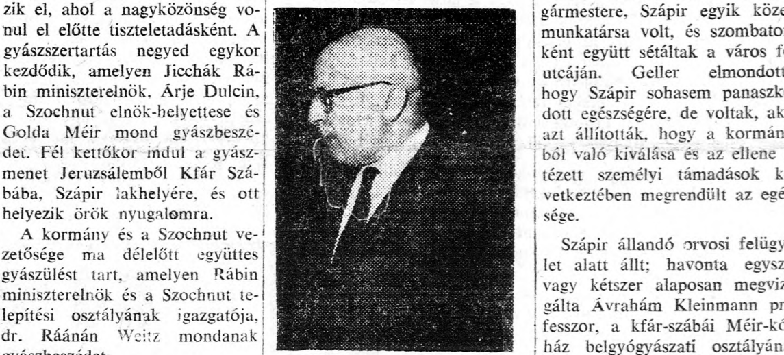
Nem hallgatott az orvosi tanácsra