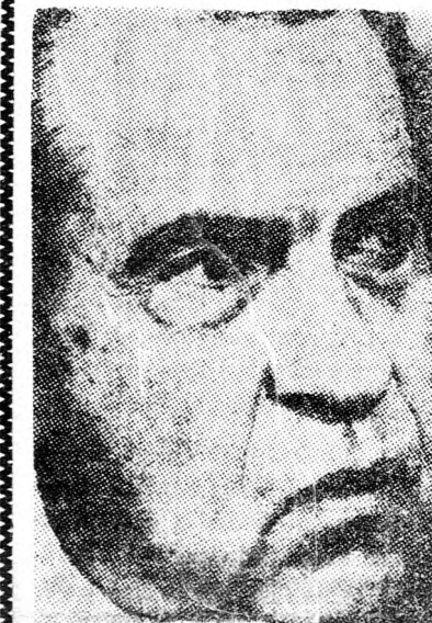
NIXON: Csak a külpolitika érdekli