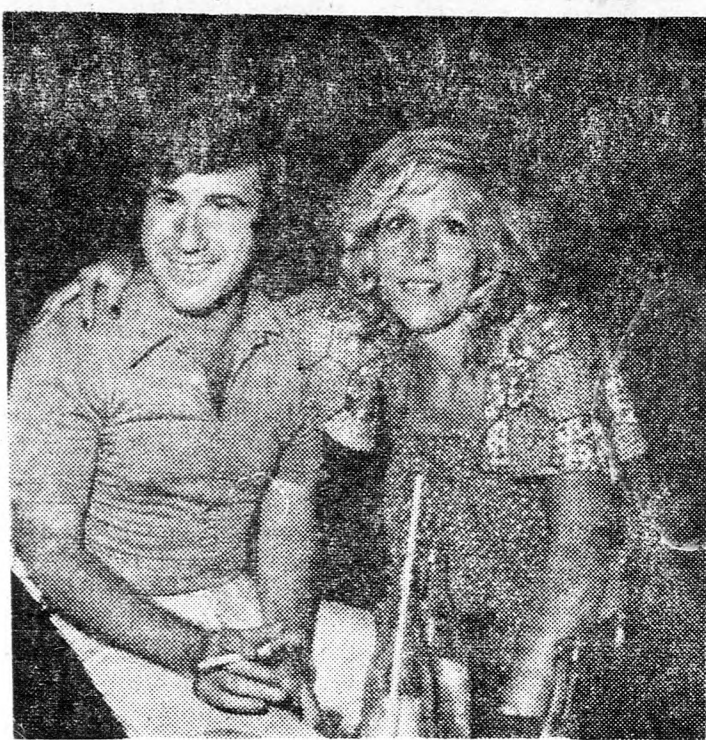
EHUD MANOR ÉS OFRA FUCHS

Avi Toledano, a népszerű izraeli slágerénekes az elmúlt hónapokat Londonban töltötte. Számos hangfelvételt készített és közönség előtt is sikerrel szerepelt. A napokban hazajön és itt-