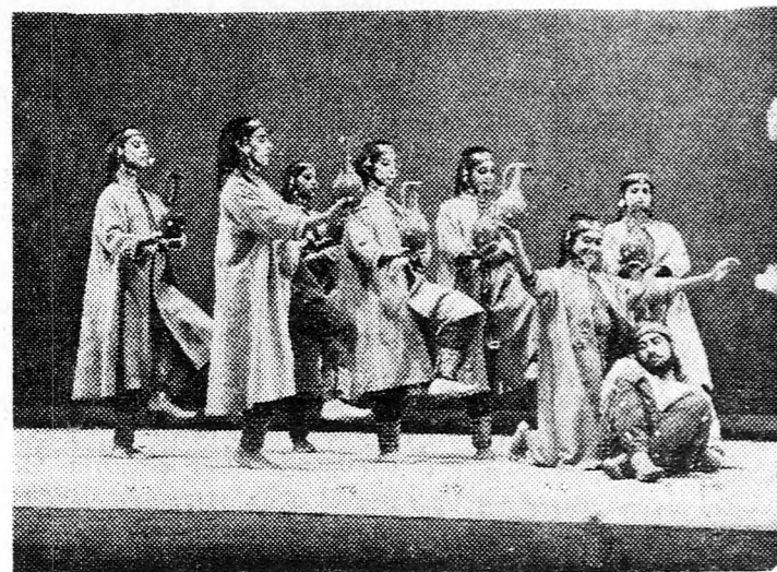
JELENET AZ INBÁL MŰSORÁBÓL