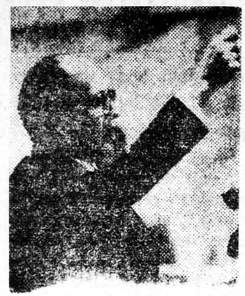
MENACHEM BEGIN Csak visszavonulás...

bizonyított. Rossz szolgálatot tennének Egyiptomban azok, akik azt ajánlanák, hogy meg-