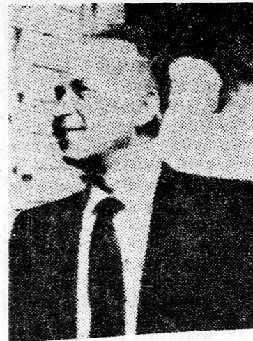
JICCHAK RABIN: Mi történik Libanonban?

Egy arab nővédek azt kérdezte, megfelel-e a válasznak az a miniszterelnök, hogy ez az ara-