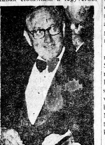
GISSINGER Két friska...

latozások kérdésében, míg a másik Kissinger figyelmeztetésének semmibe véve, hogy a Szovjetunió ne avatkozzon be Angolában.