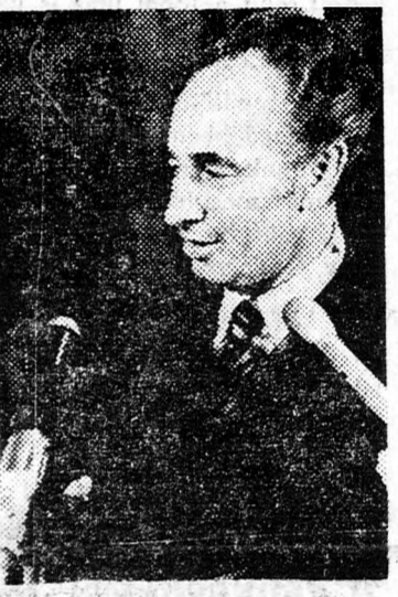
SIMON PERESZ Nemzeti egységkormány!

Peresz a következő kijelentéseket tette meg elutazása előtt: Szíria a jövőben is szelsőségek