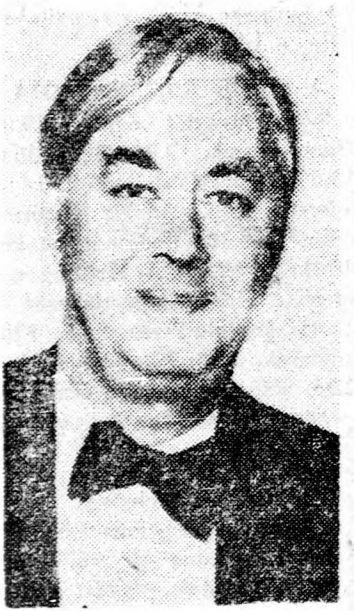
MOYNIHAN NAGYKOVET „Gyarmatosítási akarják Afrikát”

New York (UPI) — Az amerikai kormány 50 millió dollár segítséget nyújt a szovjetellenes felszabadító erőknek Angolában.