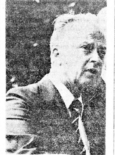
RABIN: Nehéz kérdések