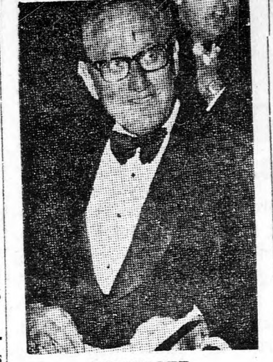
KISSINGER Bírálat — kétoldról

Londonban tegnap az amerikai nagykövetség szóvivője cáfolta azokat a sajtójelentése-