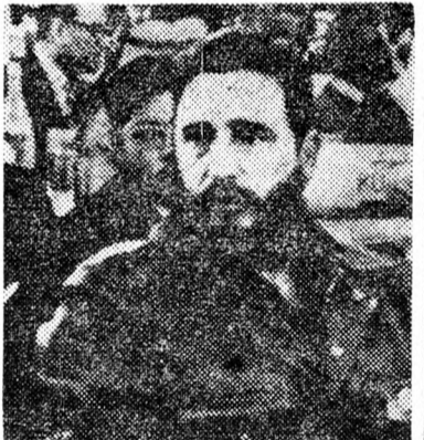
FIDEL CASTRO A tanácskozás részese

Moszkva (UPI, Reuter, IFP). — A Szovjet Kommunista Párt 25. kongresszusa ma titkos ülést tart a központi bizottság megválasztására. A központi bizottság választja meg ezután a Politbúrót, amely gyakorlatilag a hatal-