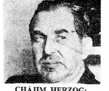
CHAJIM HERZOG: Veszélyes terv szövődik

Cháfitól keletre. A miniszter beszélgetést folytatott a körzetben szolgáló