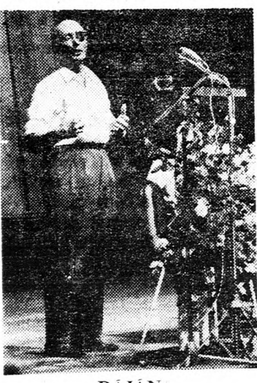
DÁJÁN Aggasztó helyzet...

harcol azért, hogy a fontos határozatokat a párt fórumain hozzák, csak ilyen módon lehet belülről megerősíteni a pártot.