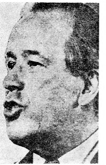
HENRY JACKSON: Első próba — győzelem!

18 százalékos támogatást kapott, míg George Wallace, Alabama állam kormányzója, a harmadik helyre