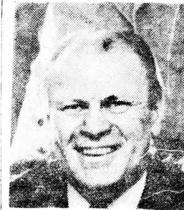
GERALD FORD Harc a zsidó szavazóért

A demokrata-párti jelöltek közül a várakozásoknak megfelelően Jimmy Carter került az első helyre, aki 440 ezer szavazatot, 34 százalékot kapott. A párt jobbszárnyán álló George Wallace, Alabama volt kormányzója, második helyre került 392 ezer szavazzal, ami 31 százalékot felel meg. Henry Jackson szenátor 306 ezer szavazzal (24 százalék) a harmadik, Jackson ezzel a helyezéssel szántotta és a harmadik helyet is állítólag jó részt a floridai zsidó támogatásának köszönheti.