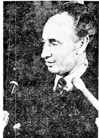
SIMON PERESZ: Tartózkodó magatartás