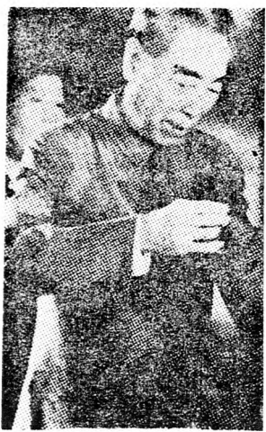
CSU EN-LÁJ Halála után is tisztelték

A kilengéseket a robbantották, megkezdődött az erőszakosság. ki, hogy tegnap, a halottak emlepnapiján, a rendőrség eltávolította Csü En-láj néhai miniszterelnök sírjától az előző nap ott elhelyezett hatalmas koszorútömeget és lezárták a „halott lelkek terét”. Hamarosan dühös tömeg verődött össze, amely átverte a rendőrkordont és Csü En-láj dicsőre jelszavakat kiáltotta a Nép Palotája elé vonult, amely a kínai parlament székhelye. Itt tartották január 15-én Csü En-láj temetési szertartását. A tüntetők azt követelték, hogy az örök nyissák ki a nagyterem kapuját. Amikor ezt megtagad-