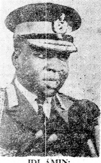
IDI AMIN: „Legjobb barátaim zsidók...”

IDI AMIN: „Mose Dáján a legjobb barátom” Idi Amin (Dada) tábornagy, Uganda egykori nehézsúlyú birkózóhajnoka és jelenlegi diktátora, aki esztelen Izrael-ellenes nyilatkozataiban odáig ment, hogy egy