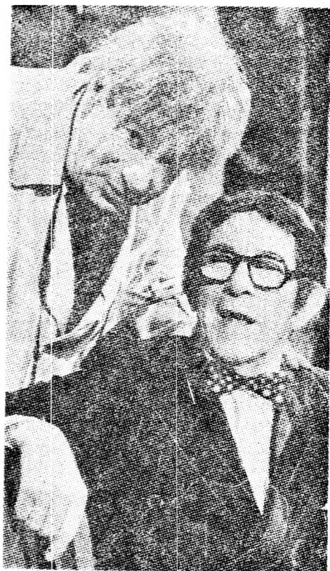
MATTHAU ÉS BURNS Kifüggő kombináció

Clark sunyi mosolyát elismeri, hogy ex-partnere, Al Lewis (George Burns) kiváló komikus: „Mint színész, senki sem jöhet a közelébe. Mint emberi lény, senki sem kíván a közelébe jönni.” A maga részéről, Lewis azt állítja, hogy Clark „mindig túl komo-