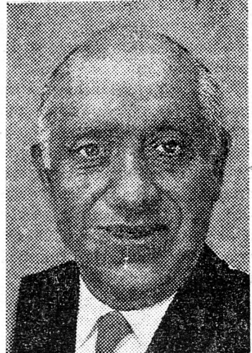
JACOB JAVITS: Harmine év múltán

Javits sajtóértekezletén elmondta, hogy ötvenéves óras megbeszélésen Szádat elnökkel főleg arról vitatkoztak, milyen szerepet játsszon a PFSZ a béke létrehozására irányuló erőfeszítésekben. Az egyiptomi elnök megismételte, hogy a palesztinai kérdést tartja a probléma velejének és arra hivatkozott, hogy Jasszer Aráfat véleménye szerint milyen mérsékelt álláspontot foglal el. „Megegyeztünk abban, hogy ebben a kérdésben nem tudunk meg egyezni” — mondta a republikánus szenátor. Javits nem volt hajlandó válaszolni olyan kérdésekre, hogy véleménye szerint mi lesz a PFSZ szerepe és mikor kerül sor a genfi konferenciára.