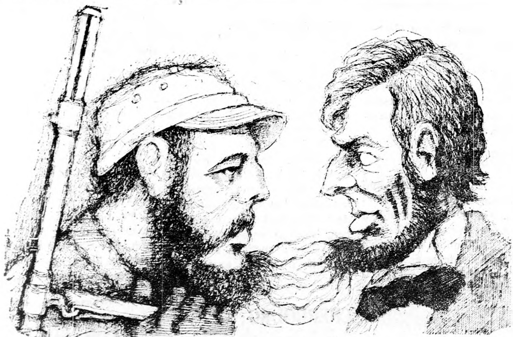
Forradalmi ping-pong: Castro — Abraham Lincoln ellen

Tel. Avivból jövet a magas ciprusfák között fekvő festői trappista kolostornál északi irányba fordulva, rátérünk a ramallai országra, amely végeredmény-