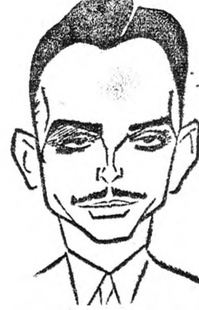
A KIRÁLY Szovjet mintára...

Damaszkuszi hírek szerint a jordán király látogatásának mai befejeződése után rendkívül fontos közlemény kibocsátása várható Jordánia s Szíria katonai, politikai és gazdasági együttműködésének újabb, elmélyítéséről.