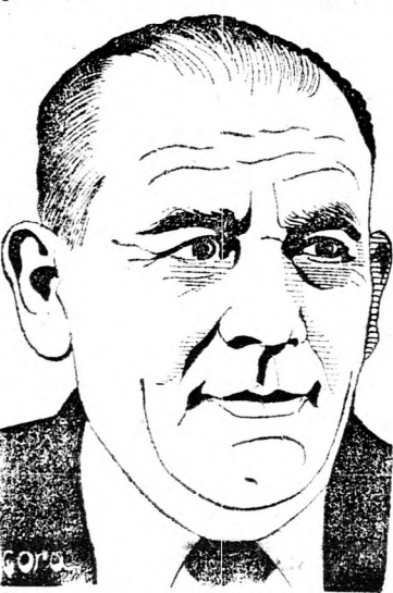
JOSZEF ÁLMOGI Olétek a Gálilba

„Az önkéntesként Izraelbe látogató külföldi zsidó ifjak 33 százaléka új oléjtelőltet. Ezért fontos volna, hogy a Gálil bekezdüljön a kirándulások térségébe”