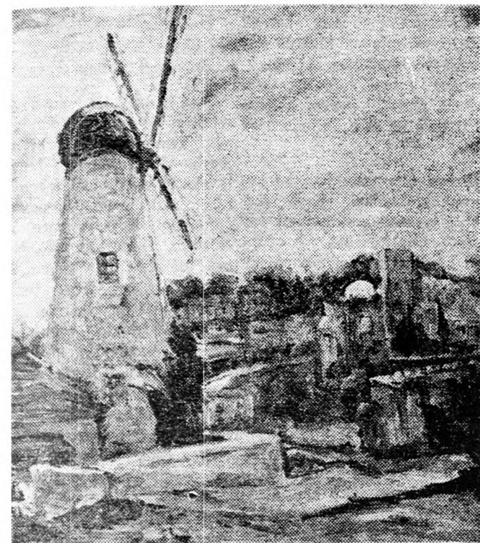
olajfestményei jeruzsálemi témára.

VISION NOUVELLE KÉPTÁR (Chucot Hájocér): James Coignard karcolatai és festményei (június 14-ig).