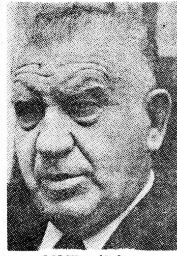
MOSE BÁRÁM Ne nyúljunk a gyermekpótlékhoz!

két esztendőben amennyi is jelentős mértékben redukáltak” — mondotta. — Ha a kormány nem nincsen más választása és előtt megtagadták tegnapi beszédében Sémtov bejelentését, hogy az egészségügyi minisztérium fejlesztési költségvetésének 50 millió fontos további csökkentése hátrányos hatással van a kórház építkezési munkálatainak beszüntetésére vonja maga után. Jelenleg hat kórház van az építkezés stádiumában. A korábbi költségvetési korlátozások miatt a körülmények kényszerítik már amennyi is beszüntítették a hatása alatt módosították a kötelező oktatásról intézkedő törvényt is — tette hozzá Jádlin, aki csalódásának adott kifejezést