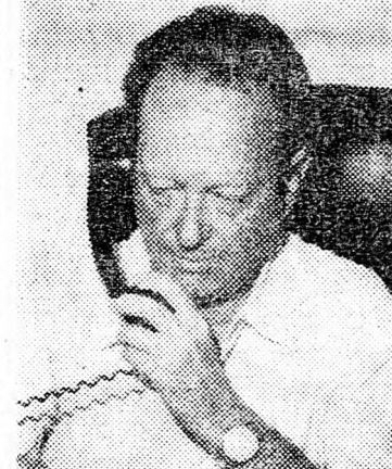
ALON: Rosszal és cáfol

A GÉP CHARTUMBA VETTE UTJÁT Ejfel után közölte az izraeli rádió, hogy az elrabolt gép nem Ammanba készül Bengáziból, hanem Szudán fővárosába, Chartumba. Ez akkor derült ki, amikor a gép Kairó légiterében volt. Mindamelltt nincs kizárva, hogy a terroristák mégis megkísérlik az ammani leszállást. A Bengáziból való felszállás előtt orvos vizsgálta meg az utasokat.