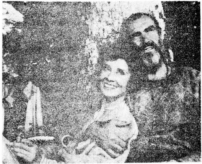
AUDREY HEPBURN ÉS SEAN CONNERY Alkalmi elfoglaltság?

Audrey ma 46 éves. Nem csinál titkot belőle. — nyilván mert tudja, hogy jó tíz évvel