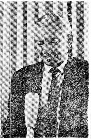
CHAJIM BAR-LÉV: „Meggondolatlan és törvénytelen”

Tibériáson teljes volt a fűszerek sztrájkja és minthogy a városban nincsenek szupermarketek