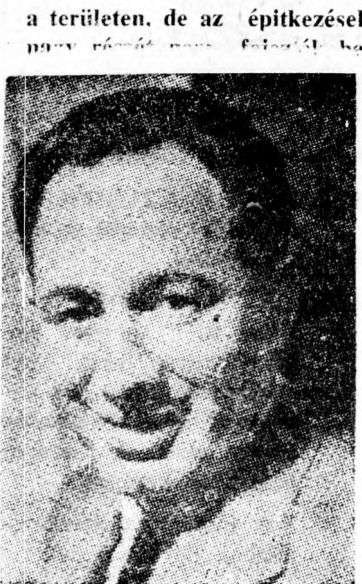
mert a katonai kormányzat le tiltotta.

kormány minden eszközzel megakadályozza, hogy megzavarják politikájának végrehajtását. A Kneszet nagy többséggel úgy határozott, hogy a külügyi és hadügyi bizottsághoz teszi át a kérdést.